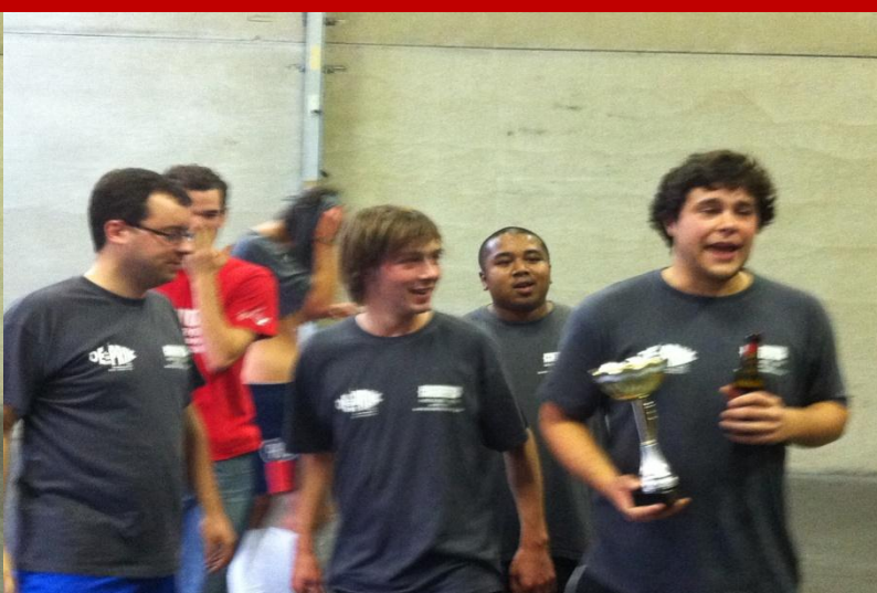
Nog geen luttel momenten na de overwinning zijn de vedetten alweer gekalmeerd en ze relativeren hun succes. Met pijn in het hart delen we mee dat de trofee voor deze winnaars niet van sterke makelij bleek te zijn. Kapot of niet, de trofee is binnen!